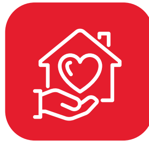
How you can help at home

تطبيق المهارات التي تم أخذها خلال الفصل في تصميم مشروع أو لعبة رياضية أختبارات بدنية و مهارية